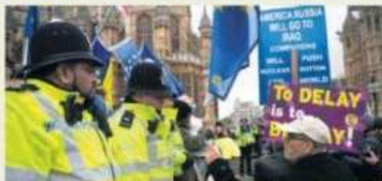
El Parlamento británico da el mandato a May para renegociar el Brexit A día de hoy se espera de la fecha acordada para que Reino Unido salga de la UE, el 29 de marzo, los diputados del Partido Conservador apoyaron el documento que sugirió a Theresa May para que debería renegociar con Bruselas la salida del país antes de la frontera con Bélgica y Dinamarca del Reino Unido. El Parlamento, que tendrá el 29 de marzo el primer debate por May, se hará con una posición privilegiada del primer y segundo voto contra un Brexit sin acuerdo - P 27

/ Ocupación. España generó 1.550 puestos de trabajo al día en 2018 / Ciclo. La economía ha recuperado 2,4 millones de empleos en cinco años de crecimiento - P28 de Economía y Empleo