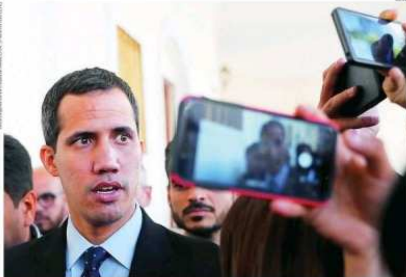
El presidente de la Asamblea Nacional, Juan Guaidó, atiende a la Prensa, ayer en Caracas